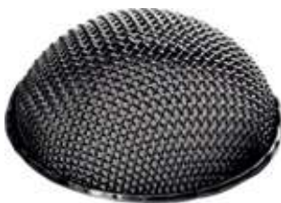
Halbrundsieb \varnothing 300 – 350 mm

Öltrennförderer. Einsatz für Trennung von Öl und flüssigem Fett, schwimmend auf der Oberfläche, in Flecken oder zusammenhängenden Schichten.