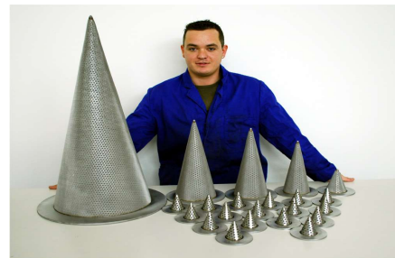
Anfahr- und Hutsiebe

Bitte fragen Sie an. Wir beraten Sie gern.